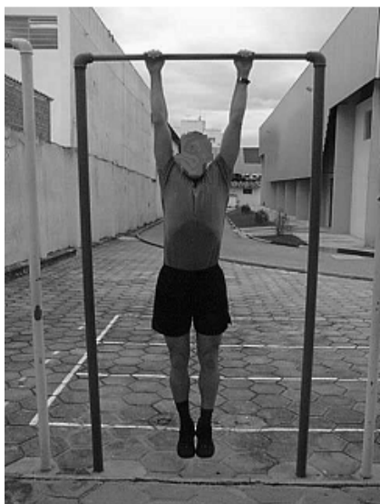
Figura 03 - Posição 3: Final do Exercício