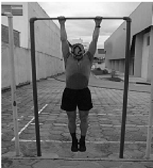
Figura 01 - Posição 1: Inicial